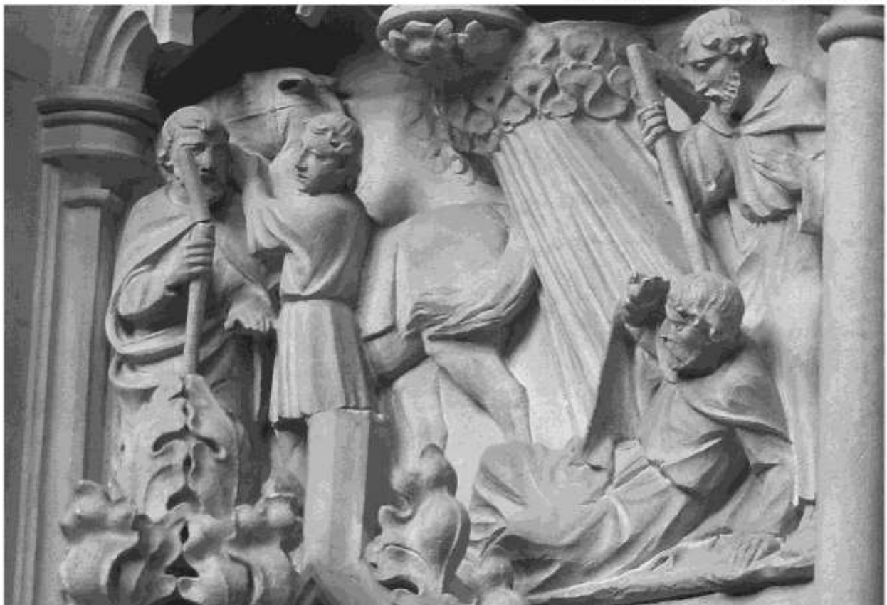
Kathedrale in Truro, Foto: Michael Tillmann

M it Blindheit geschlagen sieht er das Licht, Saulus wird zu Paulus und mit ihm tritt das Christentum aus dem jüdischen Kontext seiner Zeit heraus und wird zur Religion für die ganze Welt. Am 25. Januar feiert die Kirche dieses Ereignis, das eine wichtige Grundlage ihrer Verbreitung darstellt.